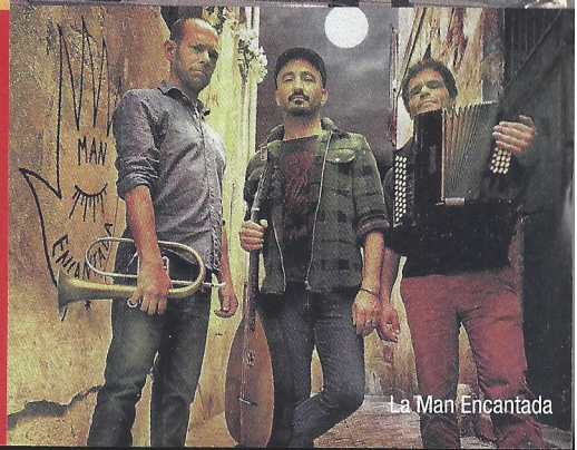
La Man Encantada

La Man Encantada, c'est la main du chaman qui trouble la volonté et le discernement. On ne sait plus si le chanteur à la mandoline nous traîne dans les rades des quais de Bordeaux ou dans quelque bayou d'un delta imaginaire, dans les longues pluies de novembre sur la lande de Gascogne, ou sous une lanterne rouge du port de Shangai. L'accordéon pompe comme on respire après l'étreinte d'une danse, tandis que le bugle fait résonner sa chaleur cuivrée, ici et ce soir. Mais, de la mandragore à l'étal de Mayan, la fille perdue du port, Asmodet veille toujours sur cette drôle d'amulette en forme de main.