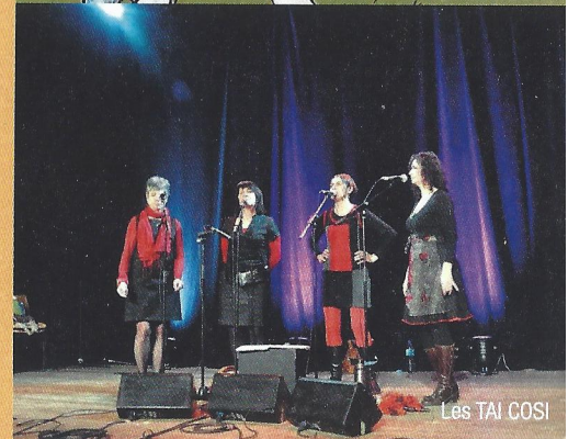
Les TAI COSI

Ces 4 Dames au chœur généreux revisitent avec enthousiasme et conviction la chanson gasconne. Elles ont poli leur son telle une plage de galets roulés par les eaux du gave. La beauté musicale prend son temps comme la nature fait son œuvre. Les chants pyrénéens font virevolter la valse, les rondes de la Grande Lande tournent dans la bonne humeur, les compositions groove pour le plus grand bonheur du public.