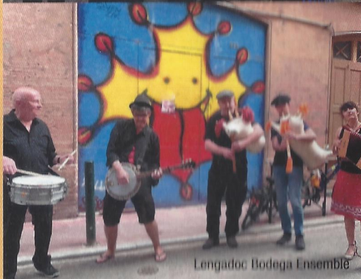
Lengadoc Bodega Ensemble

Musiques languedociennes du Lauragais, de la Montagne Noire et d'Ailleurs. Toujours plus ROOTS, et la GNAQUE ! Rodé depuis plus de 20 ans aux fêtes et circonstances en milieu rural pour foires, sabades et défilés, Lengadoc Bodega Ensemble apparaît aux sons de la bodega, la plus animale des cornemuses occitanes, du graile, le hautbois des Monts de Lacaune, du fifre, du banjo et des tambours. Très festives et dansantes c'est une réappropriation permanente de mémoires populaires per far la festa et bolegar amassa !